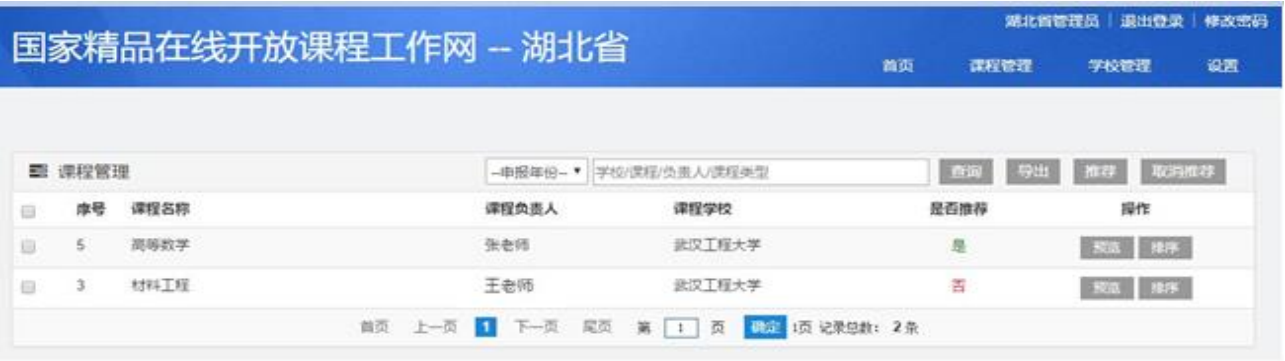
图：省级管理员课程管理

省级管理员可以查看本省所有高校提交的课程申报材料，根据省内评审结果，推荐课程参加国家精品在线开放课程评审。勾选课程，点击“推荐”按钮进行推荐，或点击“取消推荐”按钮取消推荐操作。点击“导出”按钮，可以将本省申报的课程数据以 Excel 格式导出。