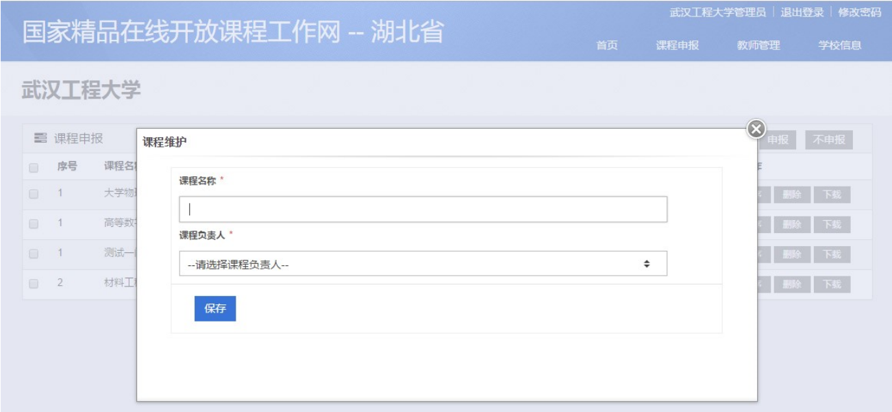
图：将课程与课程负责人关联